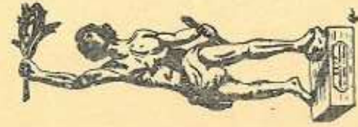
LA VICTOIRE, de FONTAINE (Bronze d'art, 0,80 de haut)

En 1936, elle mit à la disposition de l'U.S.C.F. un objet d'art, confié annuellement au vainqueur du « Challenge » de la Société.